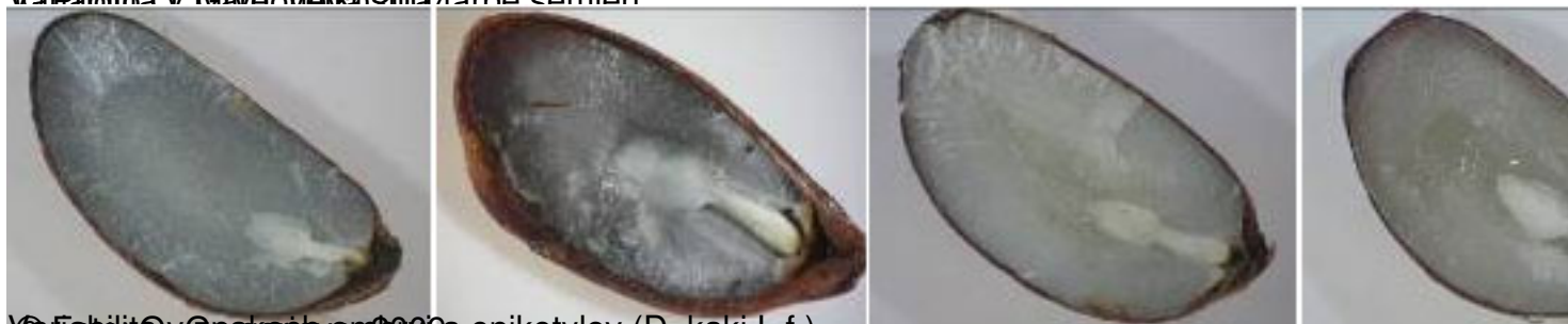
© F. Brindza, O. Grygorieva, 2009. epikotyl (D. kaki L.f.).