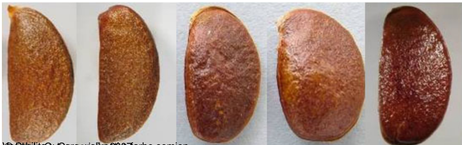
© F. Brindza, O. Grygorieva, 2009. Farba semien