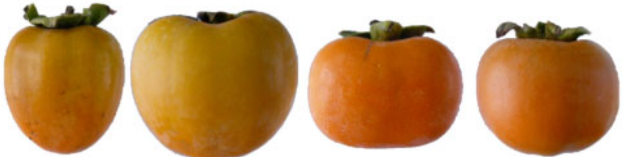
Prázdny priestor pre štípanie